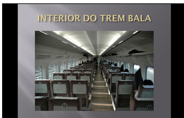
Figura 2. Portfólio dos alunos do Japão

Esse contato se deu através de duas ferramentas presentes no ambiente: os Fóruns, no qual os alunos discutiam temas diversos; e nos Portfólios, onde os alunos enviavam as atividades. O projeto teve um total de 5 fóruns com os seguintes temas: (1) apresentações e expectativas dos alunos em relação ao projeto; (2) curiosidades dos alunos em relação a cultura do outro país; (3) apresentação sobre a cidade em que residia; (4) sobre o que foi aprendido ao longo do projeto; (5) avaliação do projeto totalizando 540 mensagens. Além desses fóruns, houve um portfólio relacionado a apresentação de slides da atividade “Na minha cidade tem...”