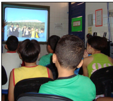
Figura 4. Apresentação dos slides (Japão)