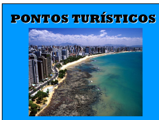
Figura 3. Portfólio dos alunos do Japão

As atividades foram pensadas objetivando proporcionar aos alunos nipônicos e brasileiros oportunidades de aprendizagem que envolvem aspectos culturais de uma forma mais significativa e dinâmica. Elas possuíam a característica de favorecer um ambiente de descobertas, a fim de que os alunos de cada país pesquisassem, questionassem e conhecessem acerca dos costumes e das culturas de outras localidades. A pesquisa consolidou-se através da análise das mensagens enviadas através dos fóruns, dos registros de observação e dos relatos dos alunos.